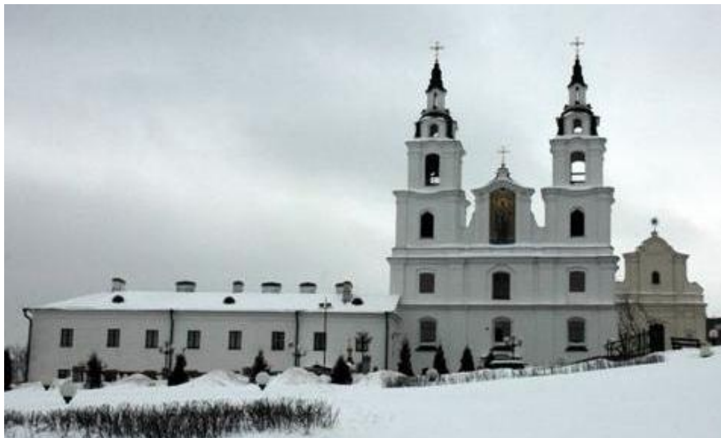
Минский Свято-Духов собор

Белорусская Православная Церковь или Белорусский экзархат - экзархат в составе Московского Патриархата.